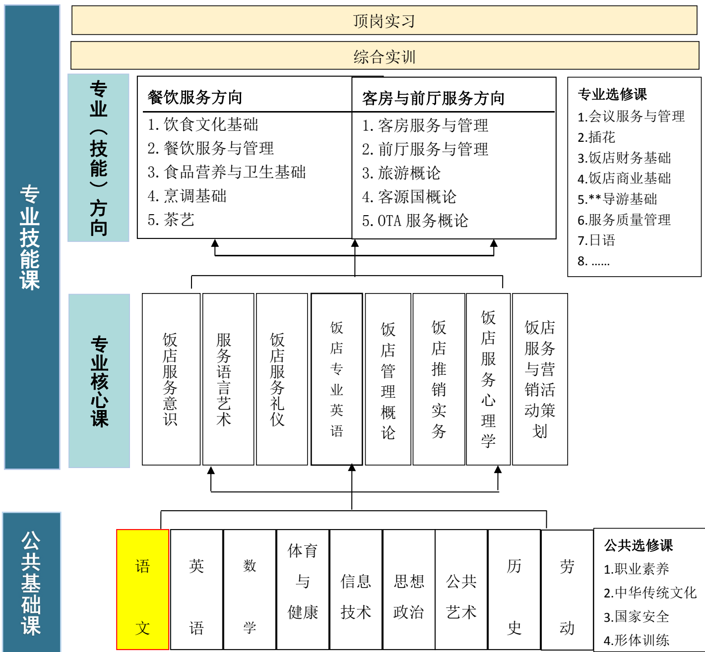
图 3：高星级饭店运营与管理专业课程结构体系