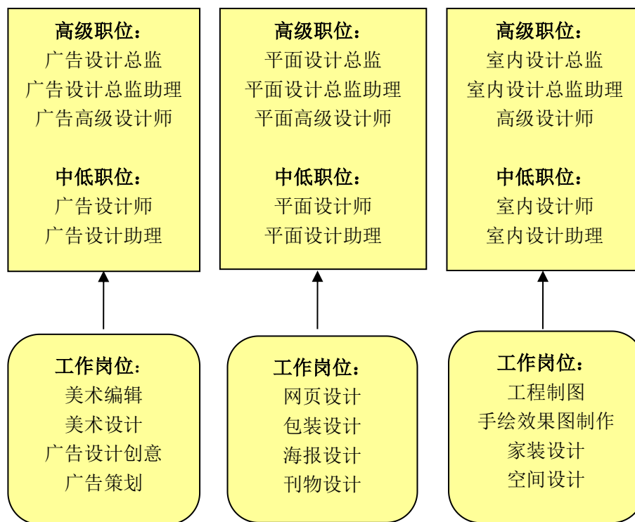
图 1：艺术设计与制作专业主要就业岗位