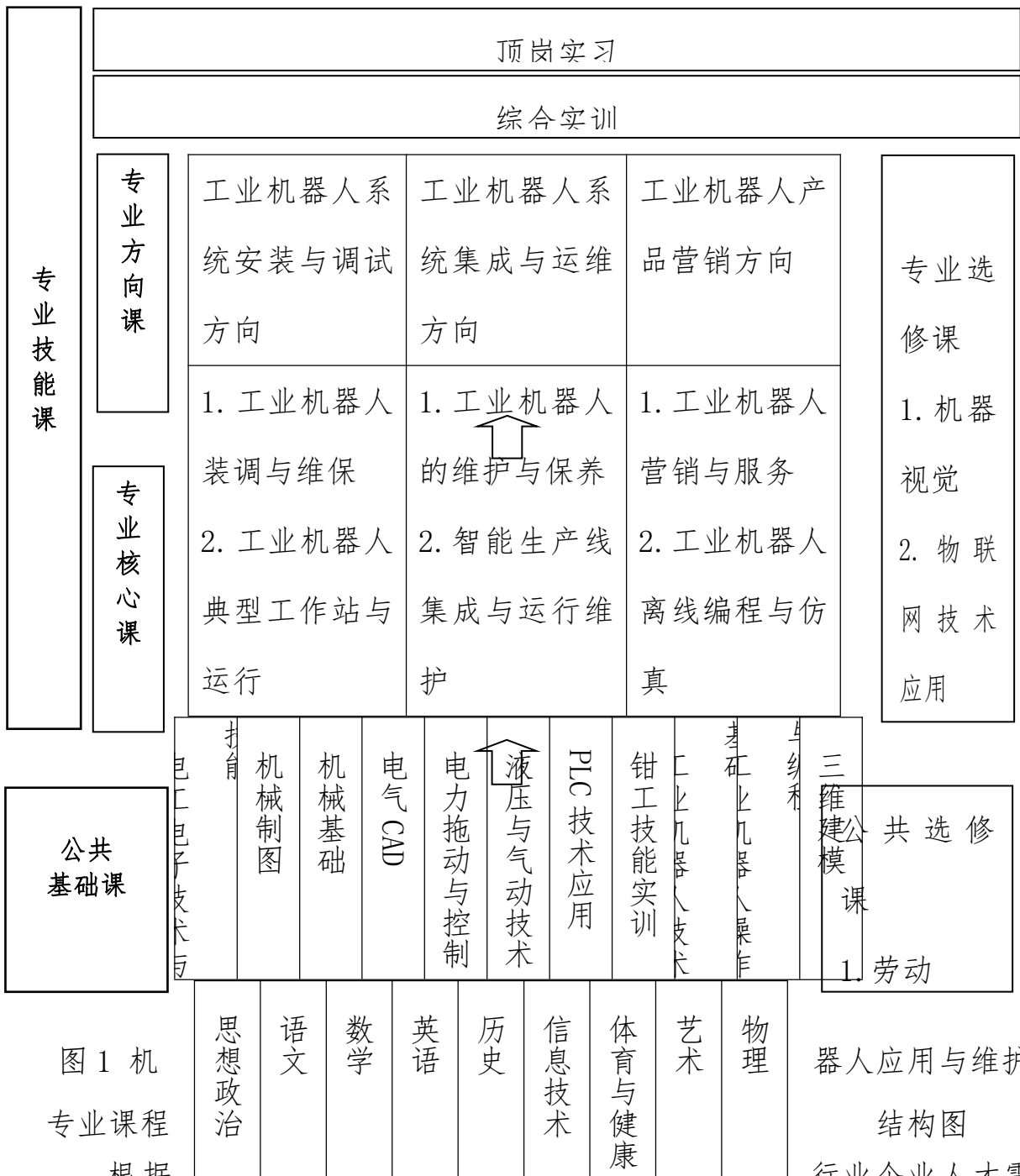
图1 机器人应用与维护专业课程结构图

根据行业企业人才需求调研、岗位职业能力分析，确定本专业岗位职业素质、专业知识和专业能力培养目标，按照“专业对接岗位、教学过程对接生产过程、课程内容对接职业标准”构建课程体系，对课程设置和课程内容进行大力整合。通