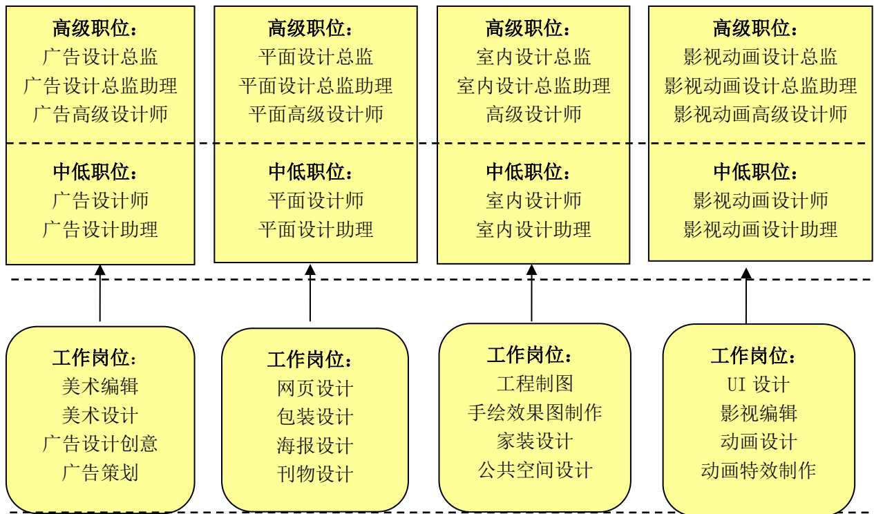
图 1：艺术设计与制作专业主要就业岗位